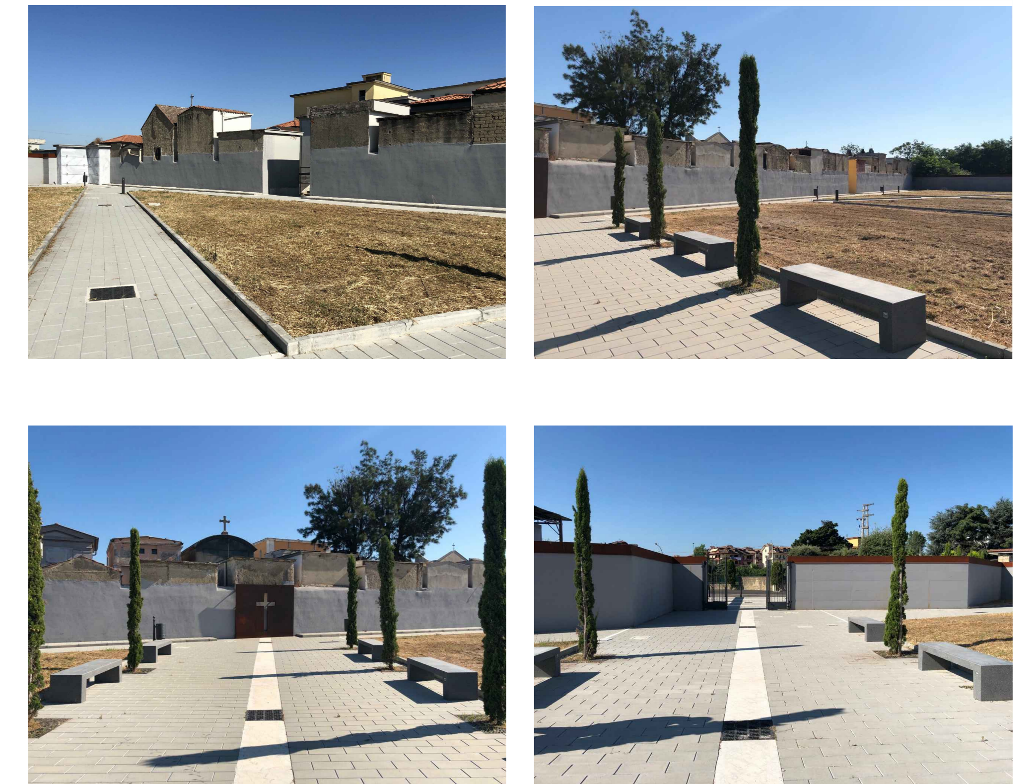
STATO DEI LUOGHI