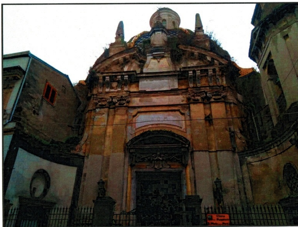
Figura 1 - Prospetto Principale Chiesa del Purgatorio