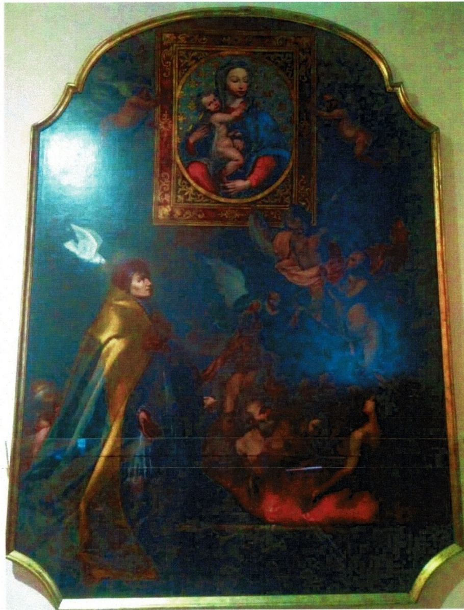
Figura 2 - Santa Maria della Purità con San Gregorio Magno e le anime del Purgatorio - Carlo Mercurio