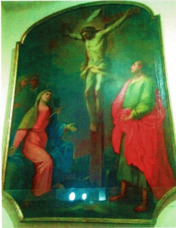
Figura 3 - La Crocifissione - Nicola Cacciapuoti

Chiesa di Santa Maria delle Purità, ed anime del Purgatorio in Giugliano in Campania (NA)