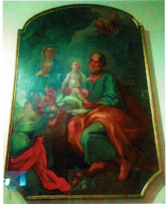
Figura 4 - La Sacra Famiglia - Nicola Cacciapuoti