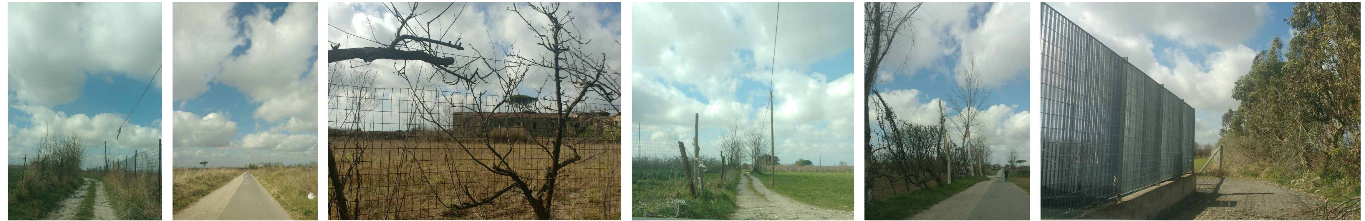
<1> <2> <3> <4> <5> <6>