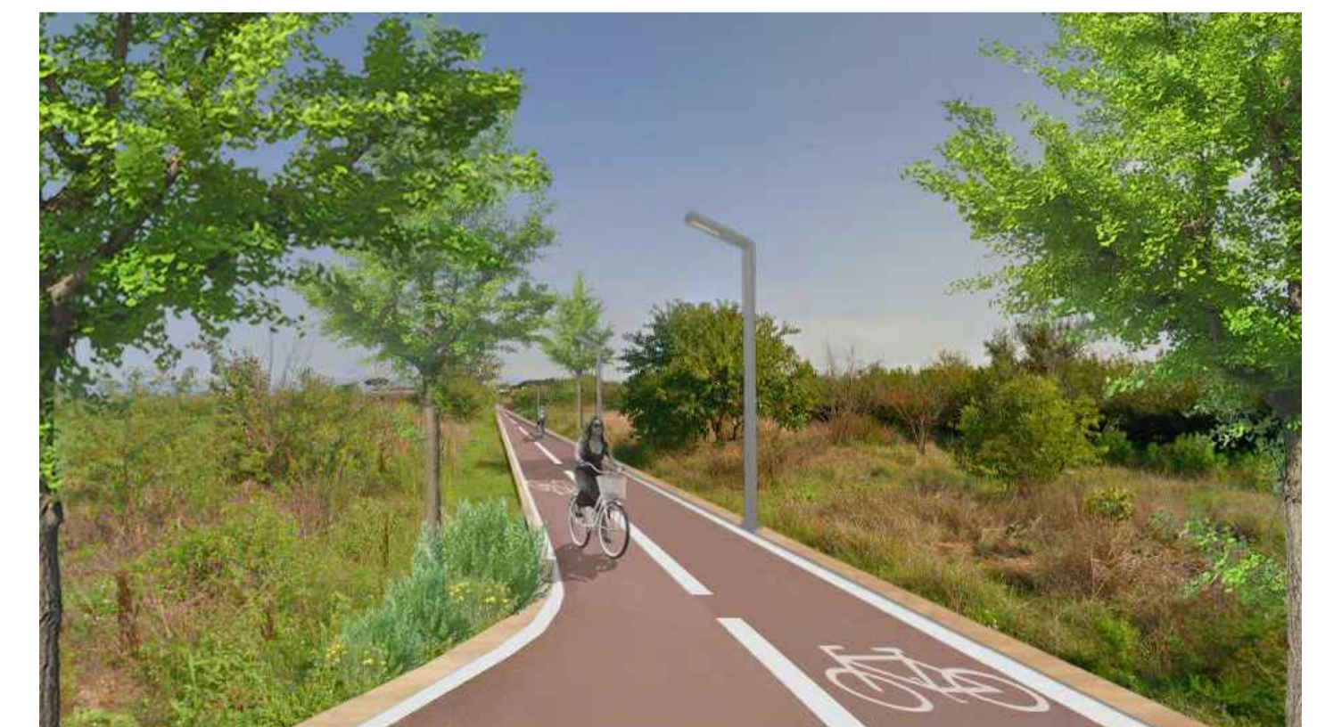
Stato di progetto - tratto Strada vicinale