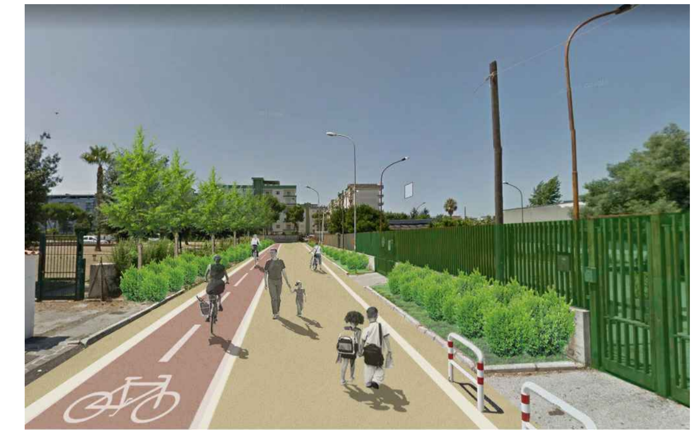
Stato di progetto - tratto Via dei Gemelli