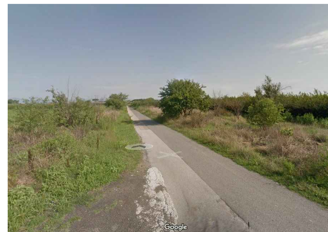
Stato di fatto - tratto Strada vicinale