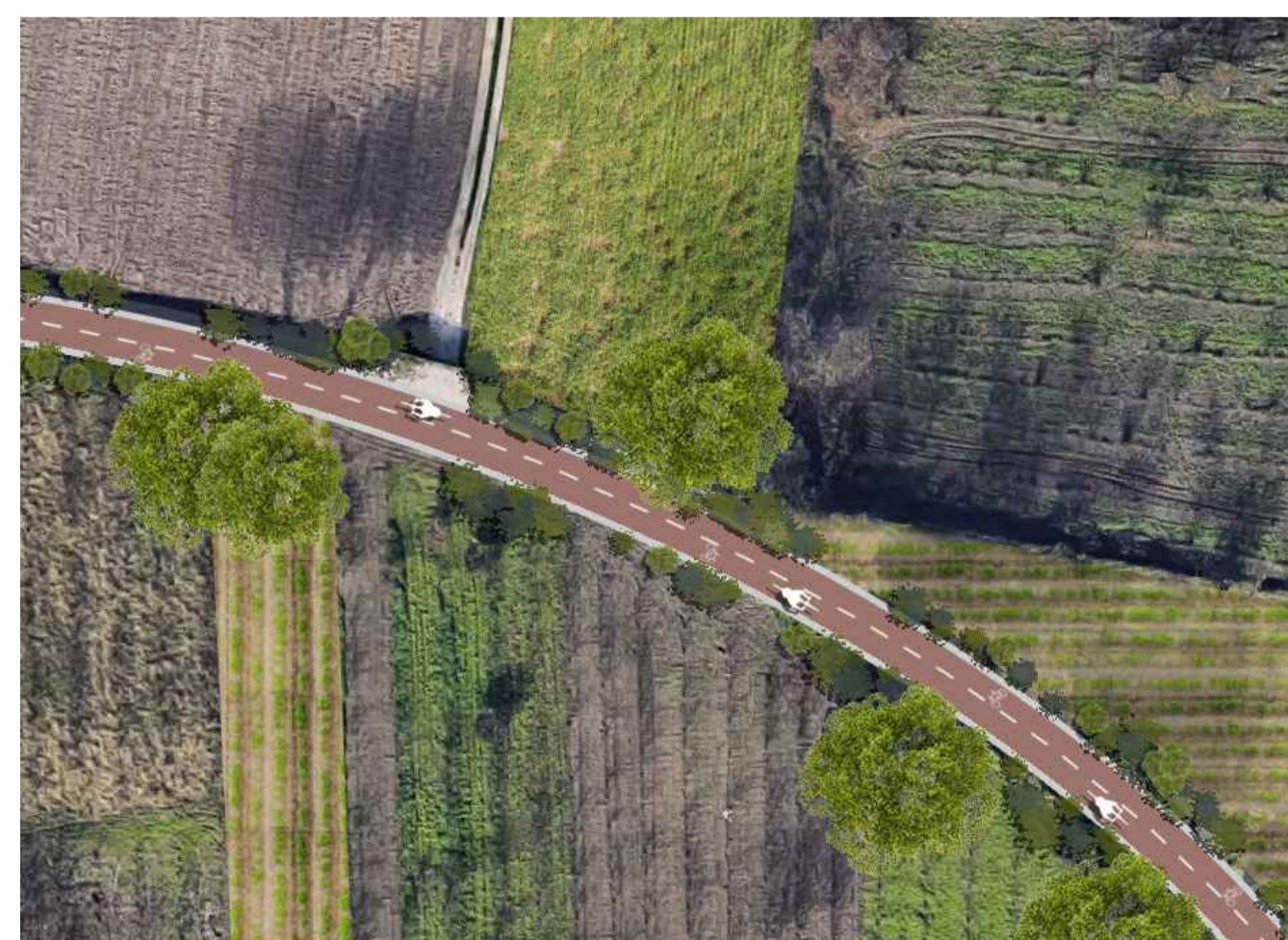
Stato di progetto - tratto Strada vicinale